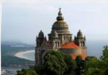
Santuário de Santa Luzia