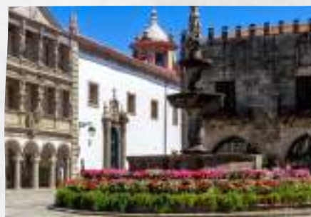
Praça da República