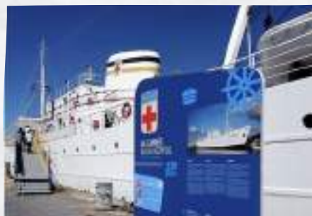
Navio Hospital Gil Eanes