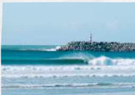
Praia do Cabedelo