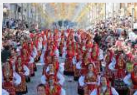
Romaria da Nossa Senhora d'Agonia