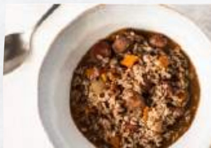
Arroz de Sarrabulho