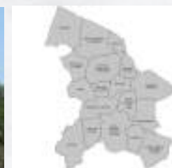
Concelho de Leiria