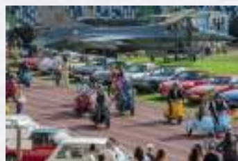
Leiria Sobre Rodas