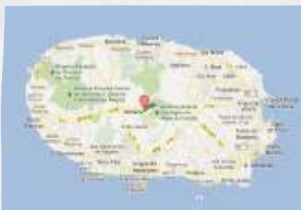
Ilha da Terceira