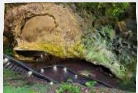
Algar do Carvão