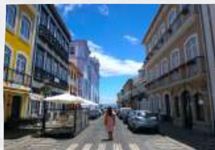
Ruas da Terceira