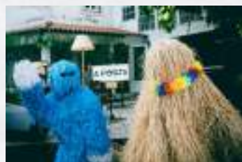
Festival A Porta

Para terminar, Leiria é uma cidade que une o melhor de Portugal, tornando-a, sem dúvida, a melhor cidade do país.