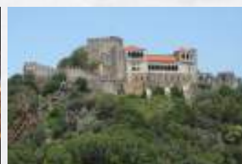
Castelo de Leiria