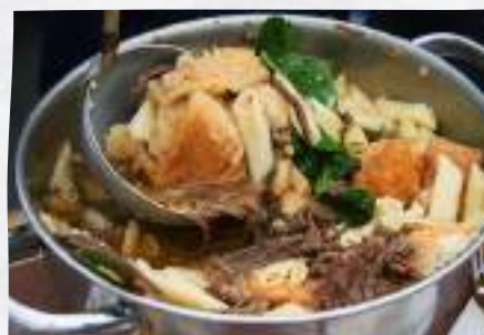
Sopa do Espírito Santo