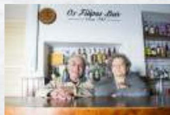
Os Filipes Bar